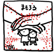
イラスト 柚木ミサトさん